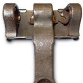
Minderwertige Nachbau-Werkstoffe führen zum Frühausfall der Hebellagerung und führen zu Heißläufern im Feld