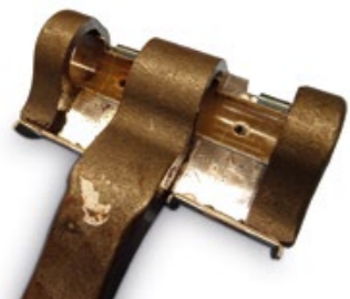
BPW Originalteile zeigen einen guten Zustand der Hebellagerung sogar nach einer kompletten Dauerlauferprobung